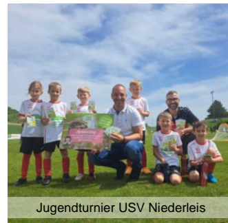
Jugendturnier USV Niederleis

Wer den Igel in seinem Garten etwas Gutes tun möchte, verfolgt übrigens am besten eine goldene Regel: Mut zur Wildnis! Je näher der Garten dem natürlichen Lebensraum des Igels kommt, desto wahrscheinlicher wird auch der Besuch des stacheligen Säugetiers.