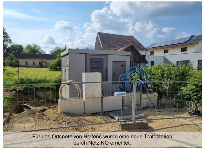
Für das Ortsnetz von Helfens wurde eine neue Trafostation durch Netz NÖ errichtet.

Nach Abschluss der Kabelverlegungsarbeiten wird die Errichtung und Inbetriebnahme der neuen Straßenbeleuchtung mit 26 Lichtpunkten durchgeführt.