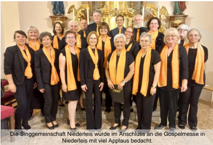
Die Singgemeinschaft Niederleis wurde im Anschluss an die Gospelmesse in Niederleis mit viel Applaus bedacht.

Am 15. Juni folgte dann noch eine Gospelmesse in Niederleis, die zur Gänze musikalisch von der Singgemeinschaft Niederleis gestaltet wurde.