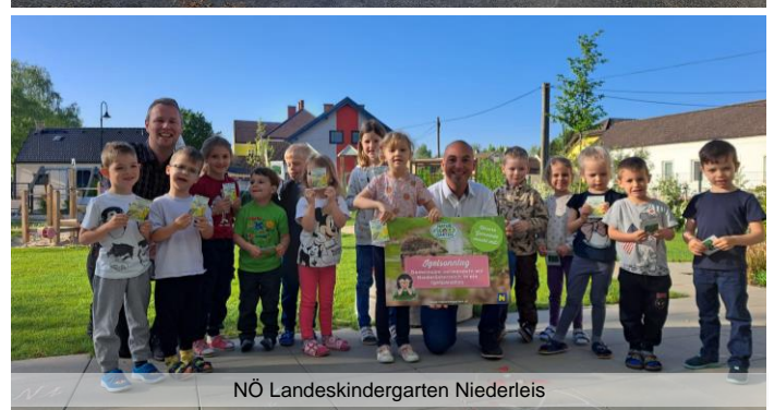
NÖ Landeskindergarten Niederleis