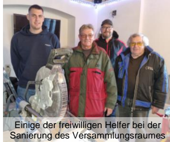
Einige der freiwilligen Helfer bei der Sanierung des Versammlungsraumes