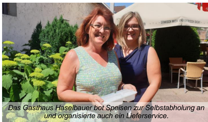
Das Gasthaus Haselbauer bot Speisen zur Selbstabholung an und organisierte auch ein Lieferservice.