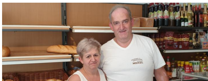
Die Bäckerei Menzl sicherte die Nahversorgung.