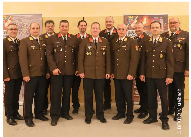
Die Abschnitts- und Unterabschnittskommandanten mit der FF-Bezirksspitze