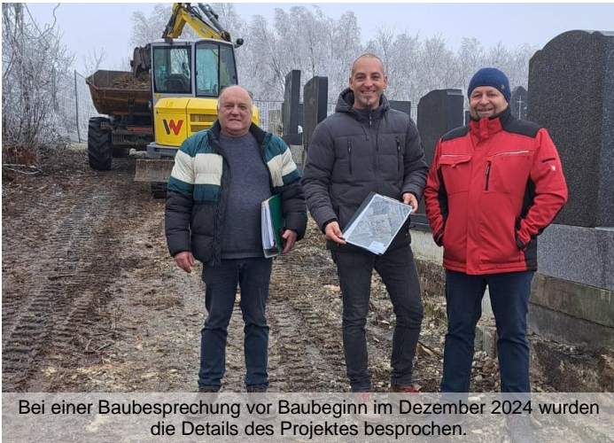
Bei einer Baubesprechung vor Baubeginn im Dezember 2024 wurden die Details des Projektes besprochen.

Mit der Neuerrichtung der Einfriedung wurde vom Gemeinderat die Firma Watzinger aus Ziersdorf beauftragt.