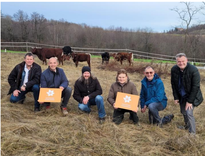
Vertreter der Naturparkgemeinden haben dem Winterquartier der Weidetiere einen Besuch abgestattet.

Zwei Wochen nach den Rindern kamen die nächsten Mitarbeiter: die Pferde! Ab dem Frühling 2025 werden die vier Konik-Pferde auf Trockenrasenflächen und Waldweiden im Naturpark tätig sein und Naturschutzarbeit leisten. Ihre natürliche Lebensweise sorgt für abwechslungsreiche Lebensräume – ideal für seltene Insekten, Vögel und besondere Pflanzenarten. Das polnische Konik ist eine urtümliche, robuste Pferderasse, eng verwandt mit dem ausgestorbenen europäischen Wildpferd – dem Tarpan.